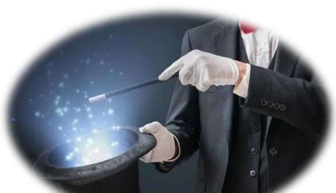
Goochelvereniging VZW Mageia